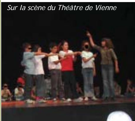
Sur la scène du Théâtre de Vienne