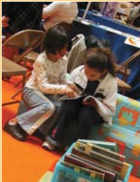
Les salons sont des lieux de rencontre avec le livre sous toutes ses formes et avec leurs auteurs.