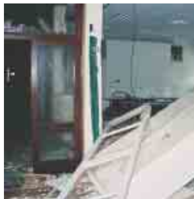
Une salle de classe après l'explosion de l'usine AZF à Toulouse.

Le Plan Particulier de Mise en Sûreté, plus communément appelé PPMS, a fait l'objet d'une circulaire publiée au BO du 29 mai 2002 suite aux tempêtes de 1999 et à l'explosion d'AZF. Son objectif est de mettre à l'abri les enfants et les personnes dans l'attente de l'arrivée des secours en cas de risques majeurs tels tempête, inondation, séisme, nuage toxique, accident industriel... Pour les écoles, l'élaboration du PPMS nécessite d'identifier les risques propres à la commune, d'informer les personnels et les parents, de gérer la communication avec l'extérieur, de mettre élèves et enseignants en sécurité, tout en respectant les contraintes indiquées (1m2 par élève, à l'étage si inondation, confinement des fenêtres si vitres brisées par une explosion, avec accessibilité des sanitaires et des points d'eau...). Le ministère informe sur les risques éventuels (BO spécial, publications particulières et site de l'observatoire).