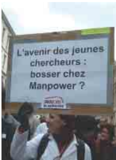
Forte mobilisation des chercheurs le 9 mars dernier.

Pour les scientifiques, si un texte n'est pas présenté avant la rentrée, aucune programmation ne pourrait être engagée avant le budget 2007. Il faut donc « mettre en œuvre dès 2005 par un collectif budgétaire le plan pluriannuel de l'emploi scientifique et technique que contiendra la future Loi