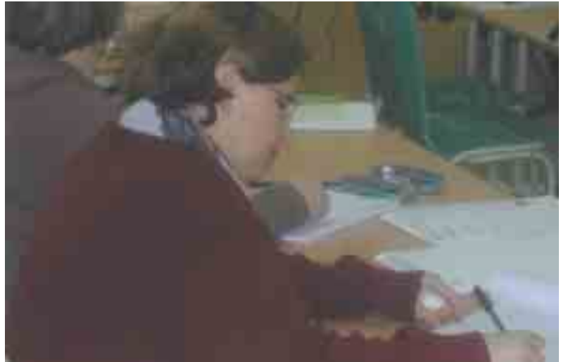
Pour sa première université du Pas de Calais, le SNUipp a rassemblé 100 enseignants.

A Stella-Plage dans le Pas-de-Calais, une centaine d'enseignants se sont retrouvés les 8 et 9 mars pour la première université départementale organisée par le SNUipp 62.