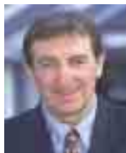
Jean-Pierre Davant, Président de la mutualité française (regroupe 95 % des mutuelles).

Tous les ans, les dépenses de santé augmentent mécaniquement et naturellement de 2 %. Il faut y ajouter les nouvelles charges pour les mutuelles santé liées notamment au désengagement progressif de la sécurité sociale qui les contraignent à de nouvelles prises en charge. C'est par exemple le cas du déremboursement de certains médicaments